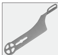
klucz do korpusu