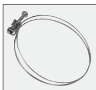
opaski zaciskowe 3 szt.