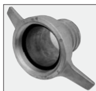
nasady 2 szt.

W komplecie wraz z każdą motopompą otrzymają Państwo: