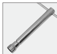
klucz do świecy