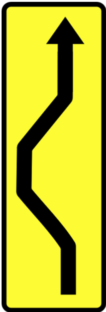
19. T-18 "Tabliczka wskazująca nieoczekiwaną zmianę kierunku ruchu o przebiegu wskazanym na tabliczce"

Należy on do grupy znaków ostrzegawczych i grupy znaków drogowych pionowych. Obowiązują dla nich następujące reguły: